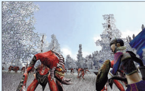
▶▶ Dos imágenes de combates en el juego.

tos que los jugadores más experimentados pueden aprovechar, sobre todo en las partidas multijugador, precisamente donde Fallen Lords refleja todo su poder, ya que las campañas para un único jugador, pecan de ser bastante monótonas y se comportan como un tutorial perpetuo.